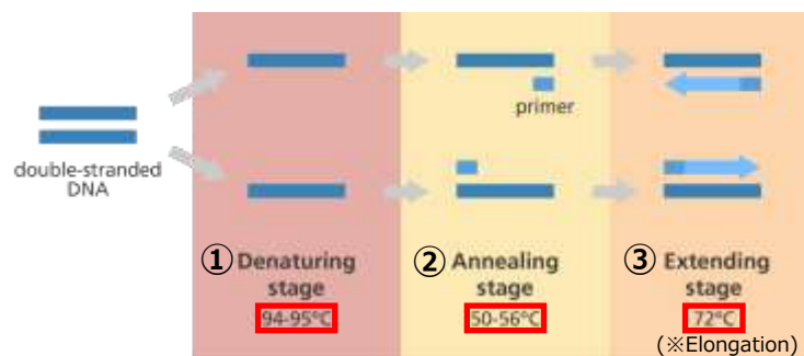
図1 PCRのイメージ図 [1]

ここで、なぜ3つのステップが同時に起こってDNAがごちゃごちゃにならないのか？と 思うかもしれません。その理由は、それぞれのステップが異なる温度で働くためです。 具体的には、