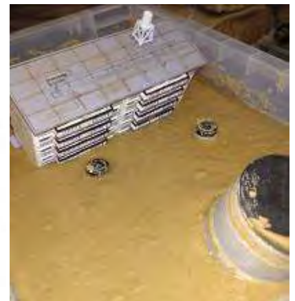
えきじょうかげんしょう も ぎ じっけん 液状化現象の模擬実験